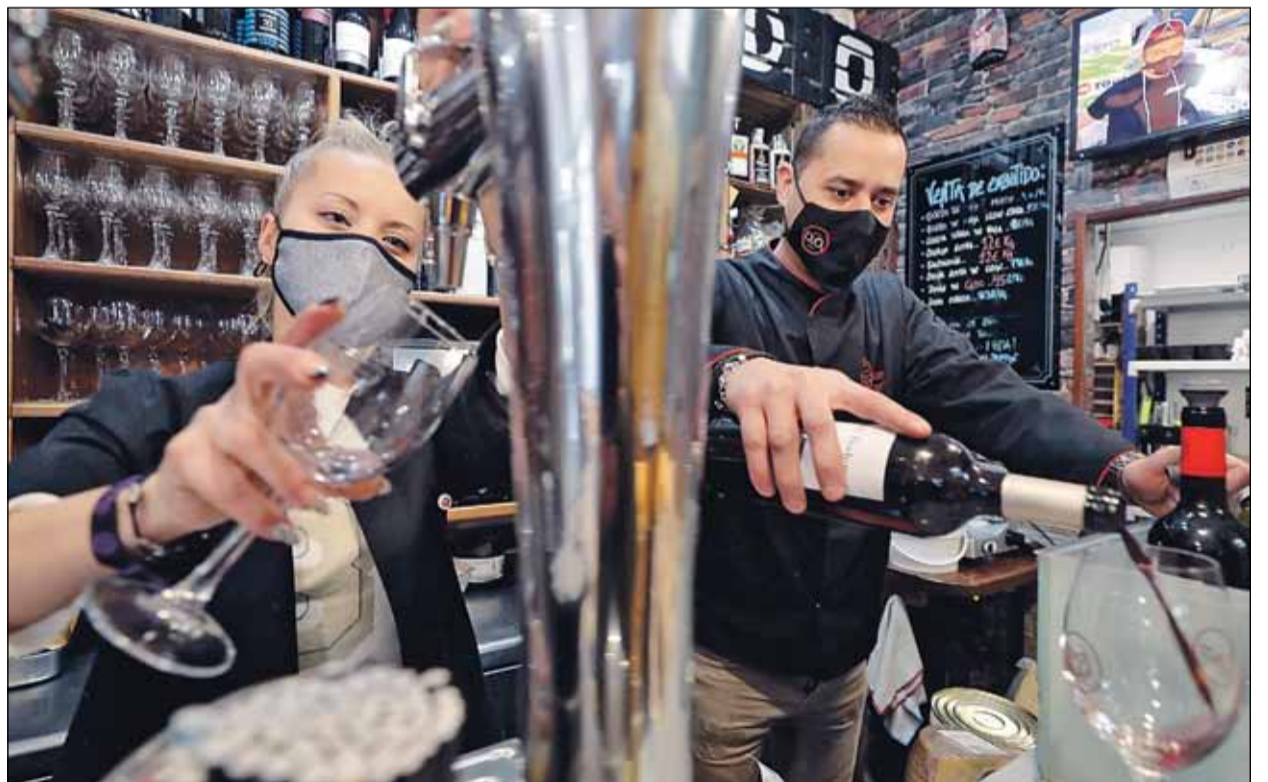
Pese a las restricciones, algunos de los hosteleros no se rinden y seguirán sirviendo en las terrazas. RAMIRO