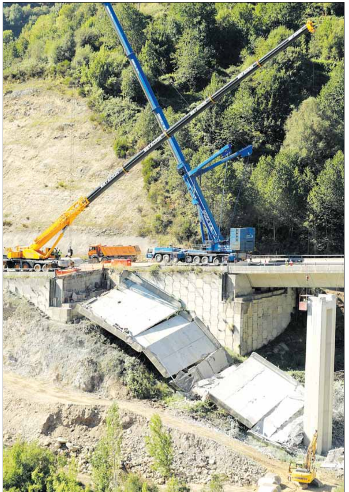
Tras la caída de los tableros en El Castro ahora comienza el desmontaje de los pilares. L. DE LA MATA

El Procurador reclama transparencia en las visitas gratuitas a los monumentos que son bien cultural Página 47